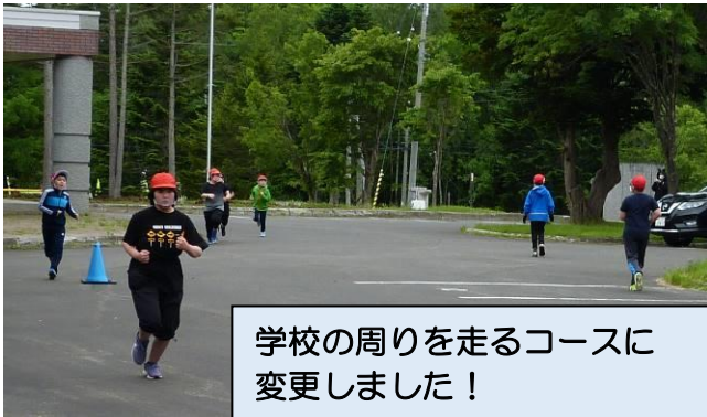
学校の周りを走るコースに変更しました!

来年は、ぜひ、たくさんの声援のもと、ベストを尽くして走るマラソン大会にしていきたいと思います。