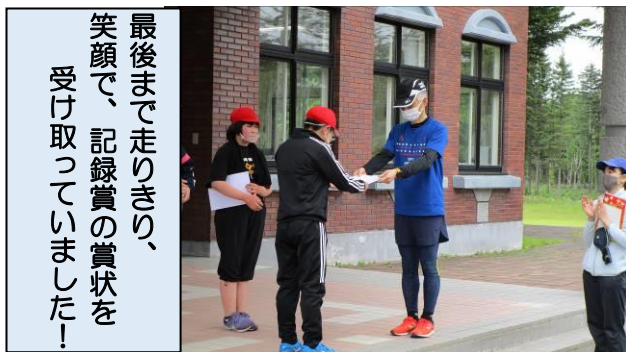
最後まで走りきり、笑顔で、記録賞の賞状を受け取っていました!