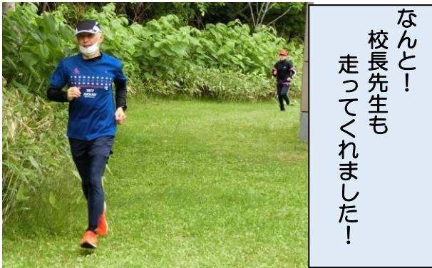
なんと! 校長先生も走ってくれました!