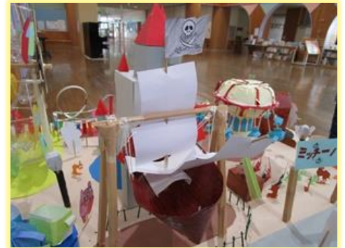
卒業制作 ミニチュア

緊迫した世界情勢の中、命を守り平和な世の中をつくるために教育でできることは何かを日々考えています。今、ウクライナで起きていること、日本固有の領土である北方領土について、他国との関係について考えることは社会科の授業のみならず、人としての生き方を考える道徳などでも避けては通れない事象です。こうした考える機会を保障すること、「学びを活かす力」をつけることが未来を変えると考えています。今後も授業で子供たちにどう関わるかを探究します。以下、今年度の総括として、卒業式の式辞の一部をご紹介します。