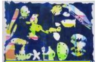
わくわくときどき にぎやかな海