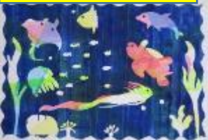
海の中の楽しいなかまたち