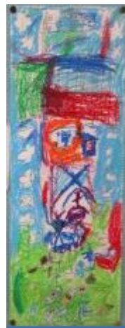
天空へ つづく タワー