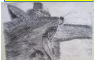
工夫点：一本一本の毛