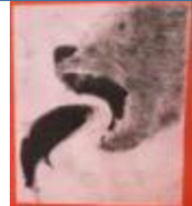
工夫点：口や鼻のかげ