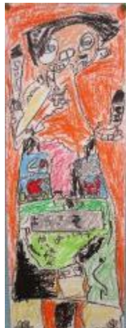
ロボットの アパート